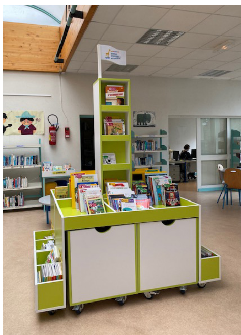
Espace EJA de la médiathèque de Bourbourg, 2020.