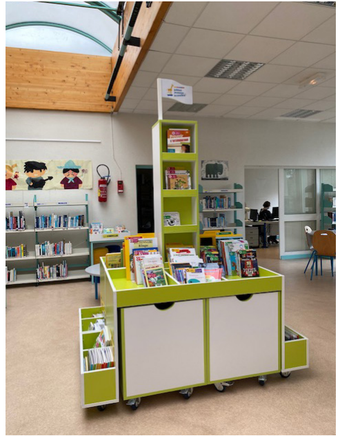
Photo d'un espace EJA du réseau des Balises (Communauté urbaine de Dunkerque)