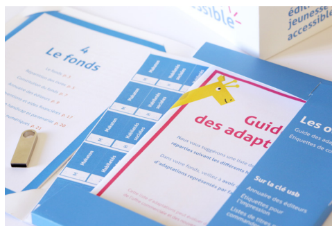
Kit EJA pour les médiathèques