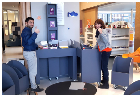
Un espace EJA